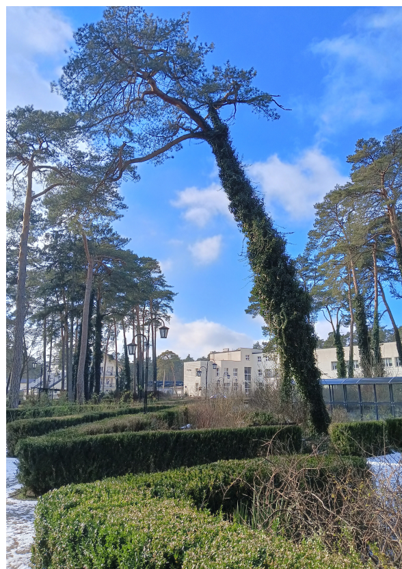
Fot. 2. Drzewo nr 291: sosna pospolita ( Pinus sylvestris )