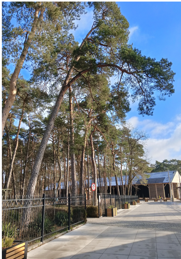
Fot. 1. Drzewo nr 1: sosna pospolita ( Pinus sylvestris )